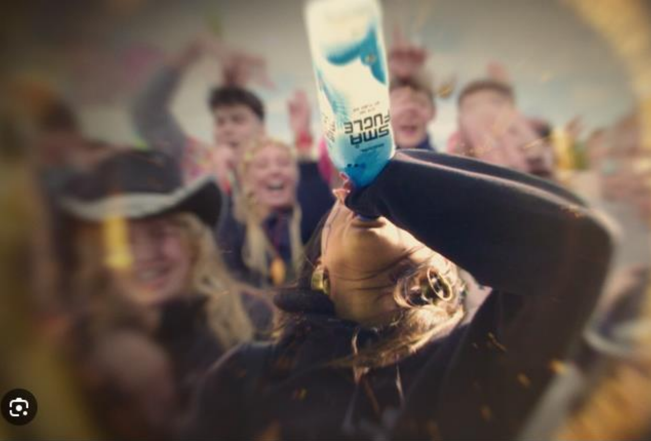
Børn på druk | Se dokumentaren her | TV 2 Play