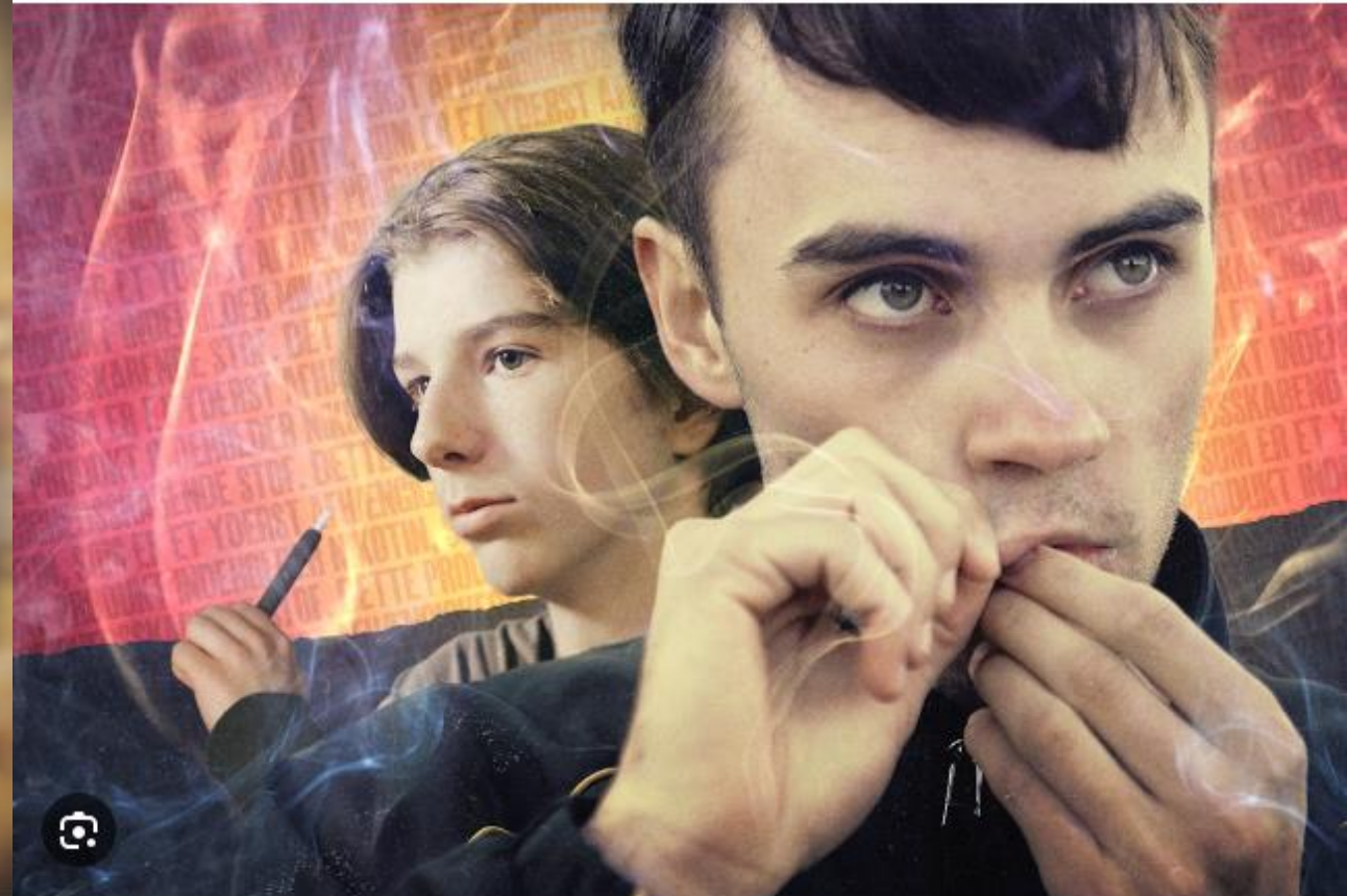
Røgsløret fra tobaksindustrien | Se dokumentaren her | TV 2 Play